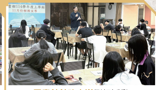
圖書館館務宣導例行活動