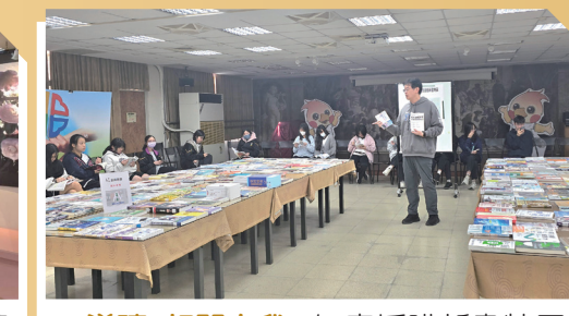
AI 導讀 超閱自我 - 年度採購新書特展