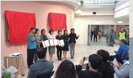
107 年度北師美術館館校合作計畫-鶯歌 OPM 專案落成揭幕