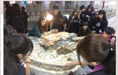
OPM 計畫 - 學生參與石膏複製作品修復