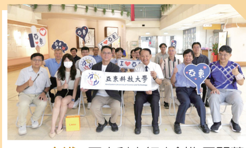
2025 交織 - 亞東科大師生創作展開幕