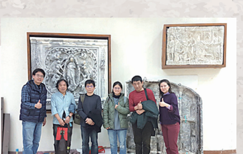
圖書館 OPM 公共藝術裝置完成合影