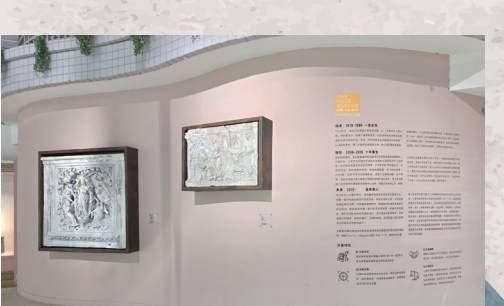
107 年度圖書館 OPM 專案公共藝術（鎮館之寶）