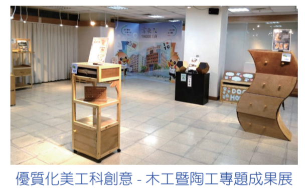
優質化美工科創意-木工暨陶工專題成果展