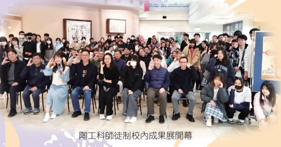
陶工科師徒制校內成果展開幕