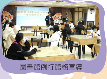
圖書館例行館務宣導