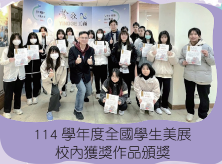
114 學年度全國學生美展校內獲獎作品頒獎