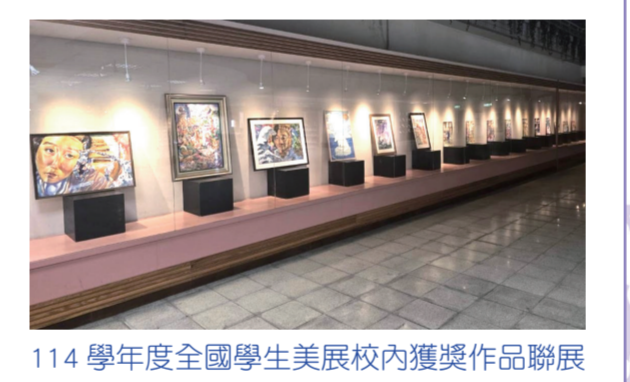
114 學年度全國學生美展校內獲獎作品聯展