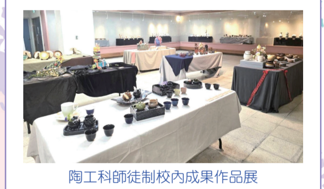
陶工科師徒制校內成果作品展