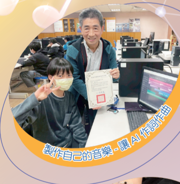
製作自己的音樂，讓 AI 陪唱歌曲

課程設計融合 AI 科技應用、數位創作、美術工藝、陶藝製作、電子控制與語言文化體驗等多元主題，強調「做中學」精神，讓學生透過實際操作與情境任務，親身體驗各科專業內涵與產業發展趨勢。活動過程中亦融入團隊合作與問題解決挑戰，引導學生發掘自我優勢與興趣所在，提升創意思考與實作能力。透過系統化且富啟發性的學習安排，協助學生建立對技職教育的正確認識，為未來升學與生涯發展奠定穩固基礎。