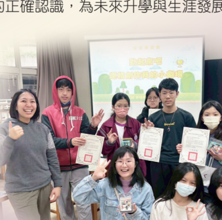
動起來吧！逐格創作我的個人小劇場