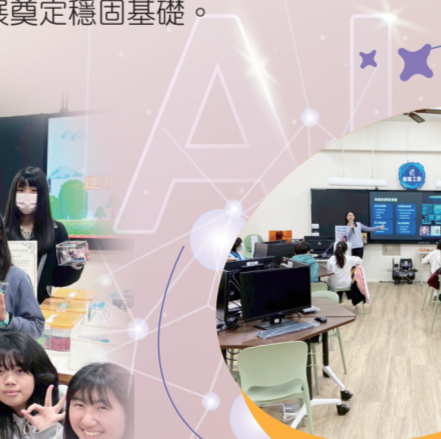
VR 視聽體驗，加速技術與產業發展