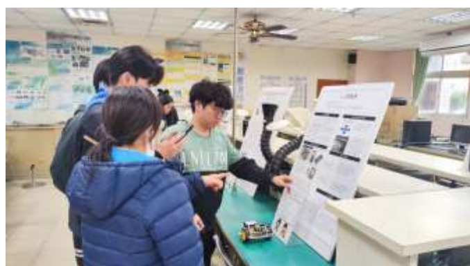
說明：專題實作成果展