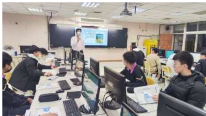
說明：行動裝置應用實習