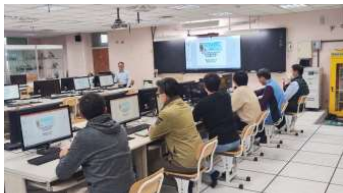
說明：資訊科教師專業增能研習