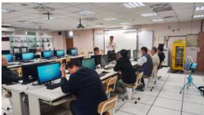
說明：資訊科教師專業增能研習