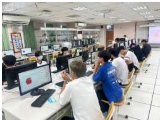
說明：專題實作協同教學