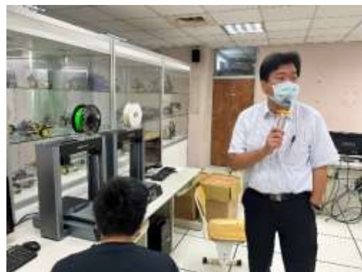
說明：專題實作協同教學