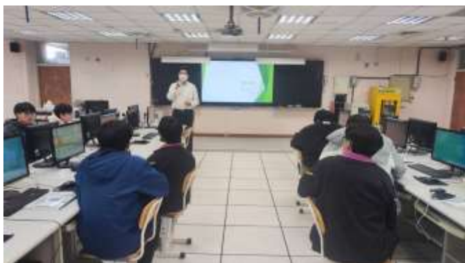
說明：行動裝置應用實習